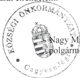
Nagy Miklós polgármester

Pamlény Község Önkormányzata vonatkozásában a 2020. december 1. napjától hatályos, Selyebi Közös Önkormányzati Hivatal Közérdekű adatok megismerésére irányuló kérelmek intézésének és a kötelezően közzéteendő adatok nyilvánosságra hozatalának szabályzatában foglalt előírások értelemszerű alkalmazását elrendelem.