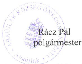
Rác Pál polgármester

Gagybátor Községi Önkormányzata vonatkozásában a 2020. december 1. napjától hatályos, Selyebi Közös Önkormányzati Hivatal Közérdekű adatok megismerésére irányuló kérelmek intézésének és a kötelezően közzéteendő adatok nyilvánosságra hozatalának szabályzatában foglalt előírások értelemszerű alkalmazását elrendelem.